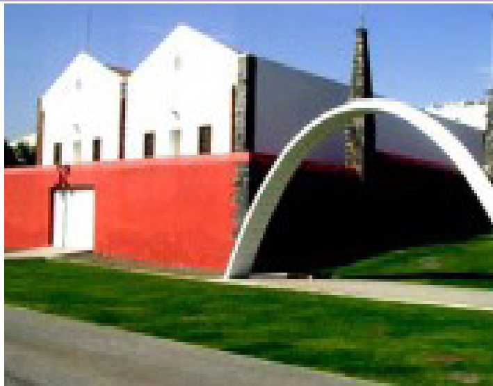
Fotografía del inmueble