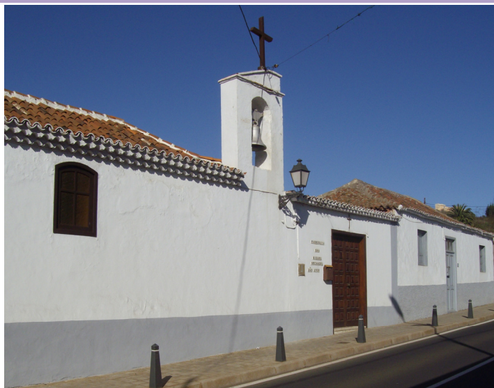
Fotografía del inmueble