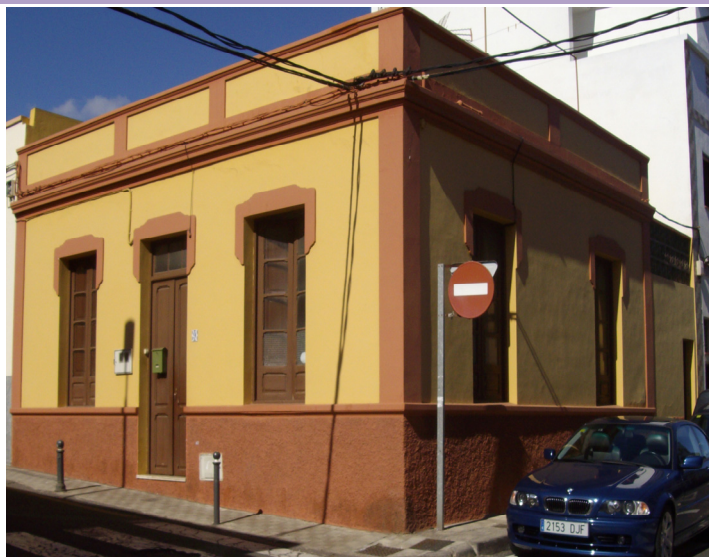
Fotografía del inmueble