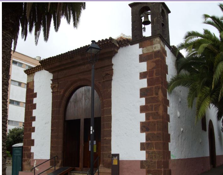
Fotografía del inmueble