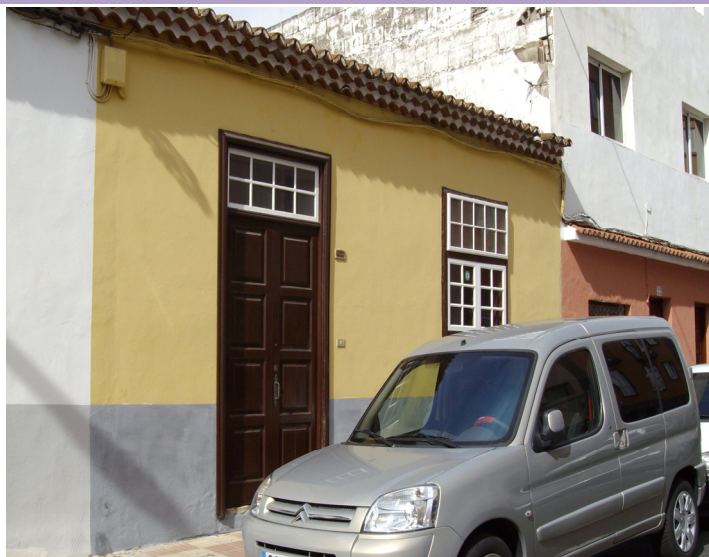
Fotografía del inmueble