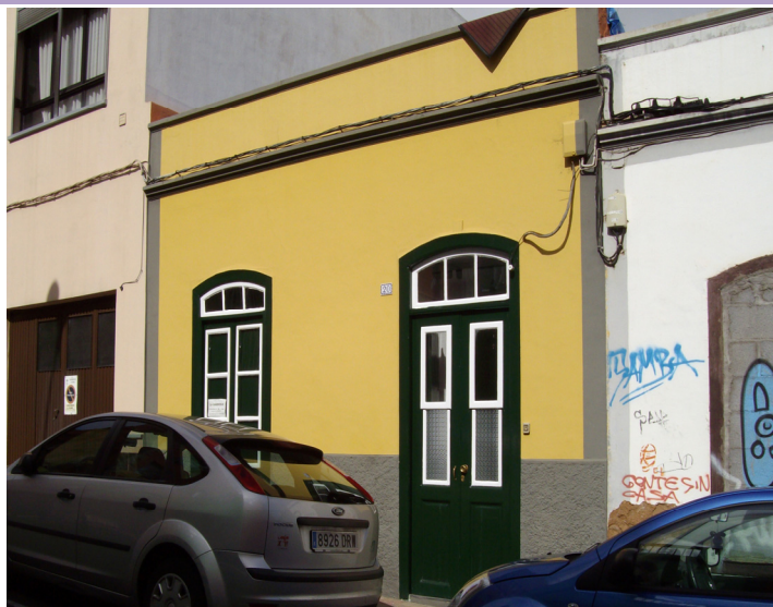
Fotografía del inmueble