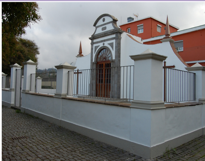
Fotografía del inmueble