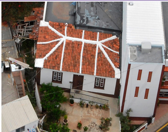
Fotografía del inmueble