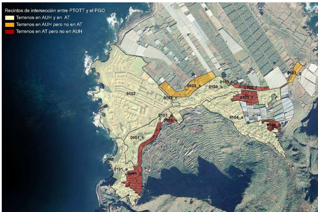
Figura 3: Recintos de intersección entre las AT del PTOTT y las AUH del PGO en Punta del Hidalgo