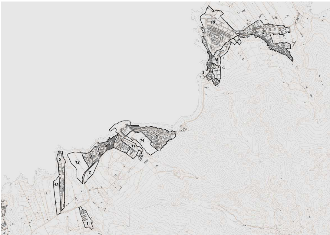
Figura 2: Delimitación de las Áreas Turísticas de Bajamar-Punta del Hidalgo

Como ya se ha dicho, el Plan Territorial delimita Punta del Hidalgo y Bajamar como una misma Zona Turística, conformada por dos recintos discontinuos, y en la cual, a su vez, delimita 15 Áreas Turísticas (AT). Los criterios de división del Plan Territorial son en gran medida análogos a los que establece este Plan General para la delimitación en cada núcleo de las correspondientes Áreas Urbanísticas Homogéneas (AUH) por lo que se verifica un alto grado de correspondencia entre ambas divisiones. No obstante, existen algunas divergencias derivadas fundamentalmente de un mayor detalle de la división del PTOTT que no se ha considerado conveniente para los efectos del PGO. A continuación, se relacionan y describen las 15 AT de acuerdo al Plan Territorial, señalando para cada una de ellas la correspondencia con la división en AUH del PGO.