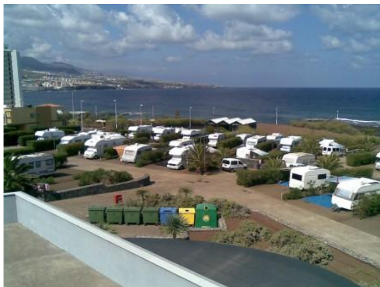
Figura 18: Camping de La Punta del Hidalgo