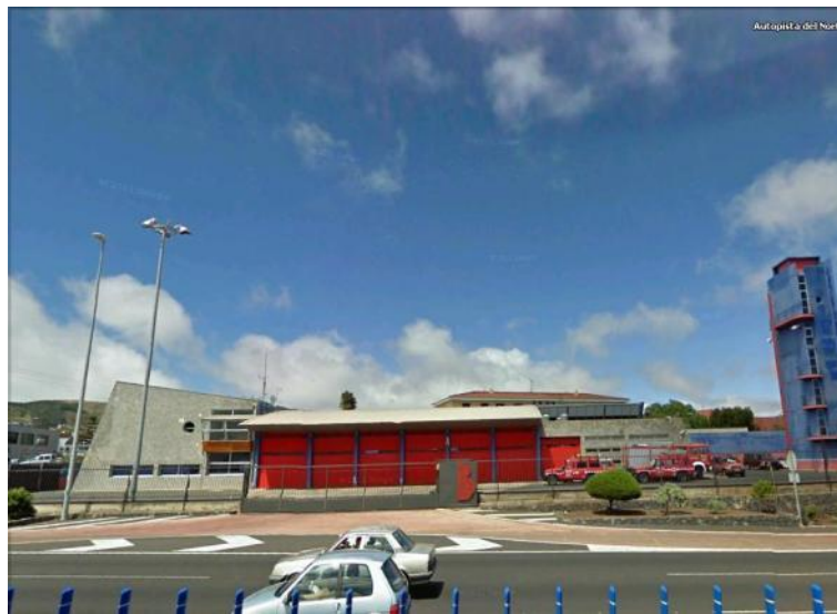
Figura 7: Estación de bomberos