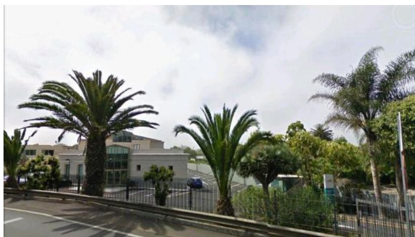
Figura 29: Sánchez Bacallado