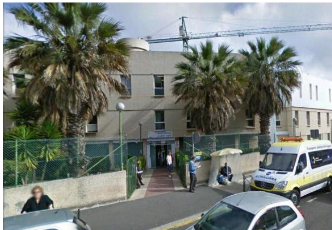
Figura 9: CAE Laguna-Geneto