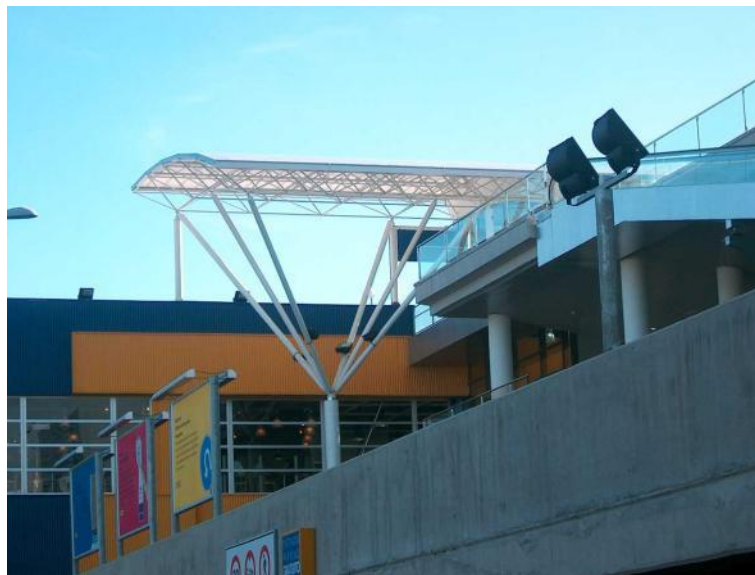
Figura 33: Centro Comercial Ikea