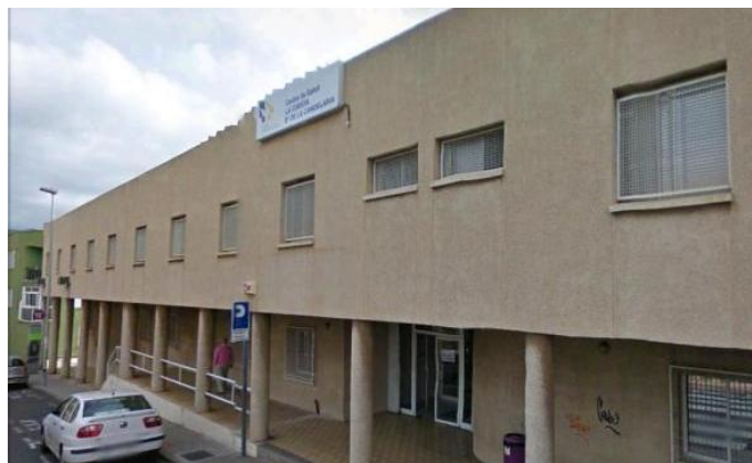
Figura 11: Centro de salud de La Cuesta