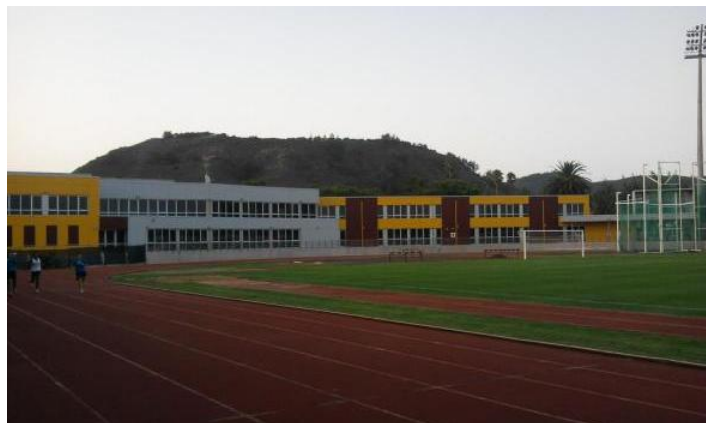
Figura 19: Estadio de la Manzanilla