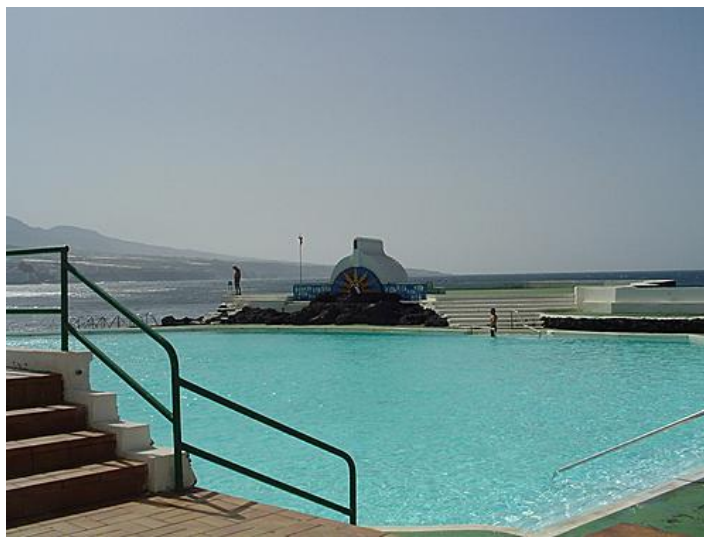
Figura 36: Piscinas Altagay