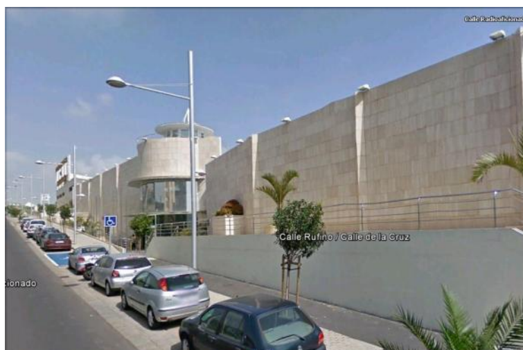
Figura 34: Centro Comercial del mueble