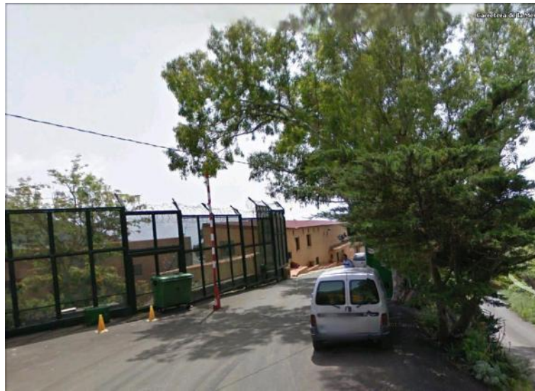
Figura 4: Centro de menores con medidas judiciales “Valle de tabares”