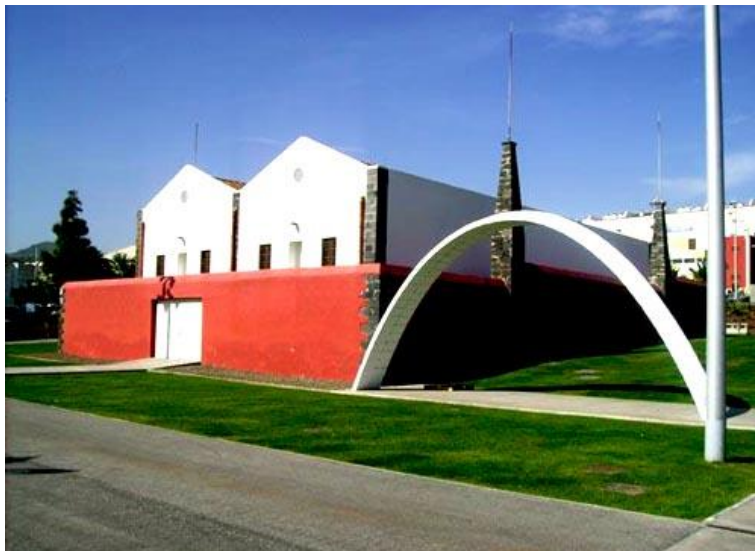
Figura 25: Parque El Polvorín