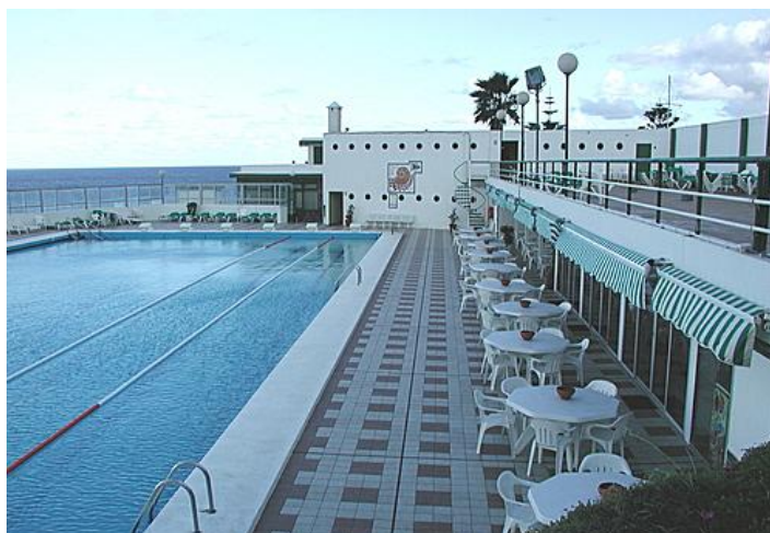
Figura 31: Club Náutico de Bajamar