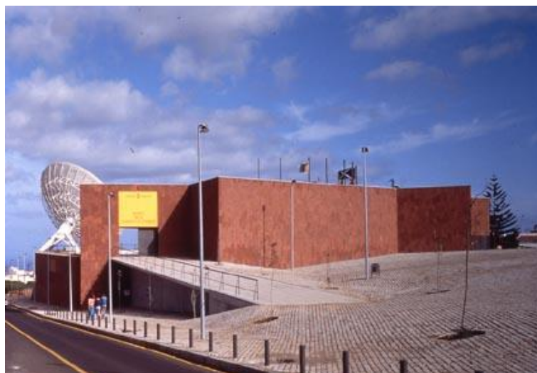
Figura 17: Museo de la Ciencia y el Cosmos