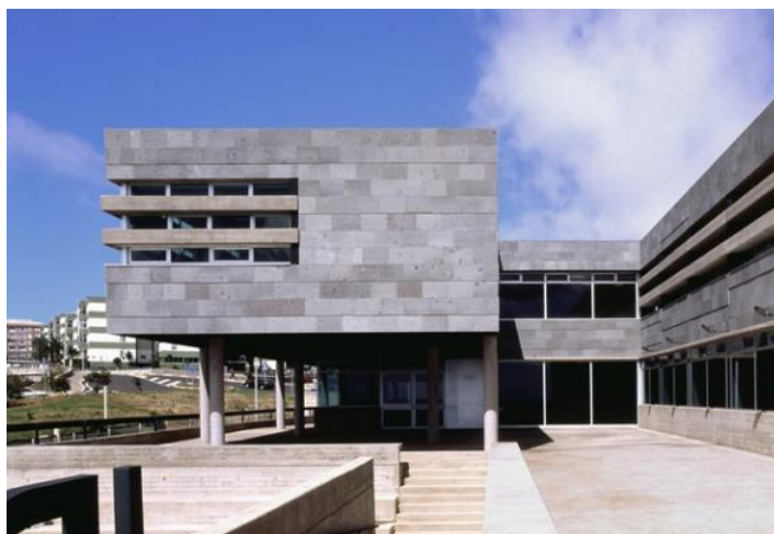
Figura 16: Escuela oficial de Idiomas de La Laguna