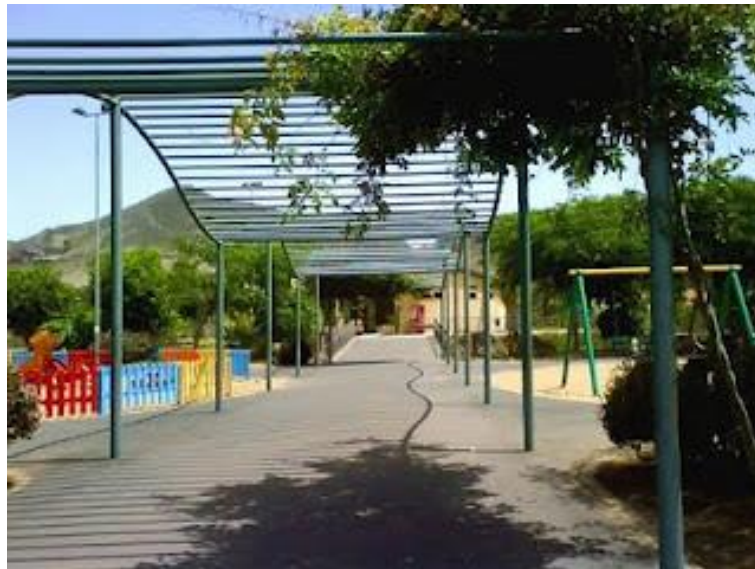
Figura 24: Parque La Vega