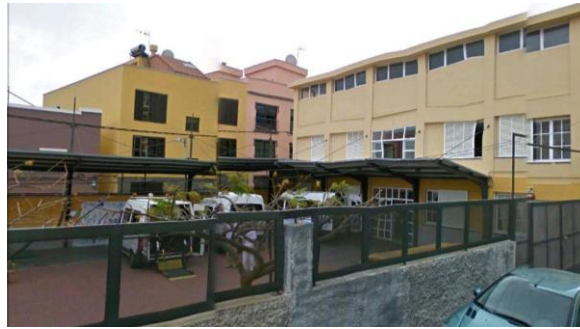
Figura 10: CAMP La Laguna