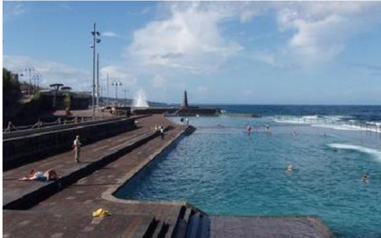
Figura 23: Piscinas de Bajamar