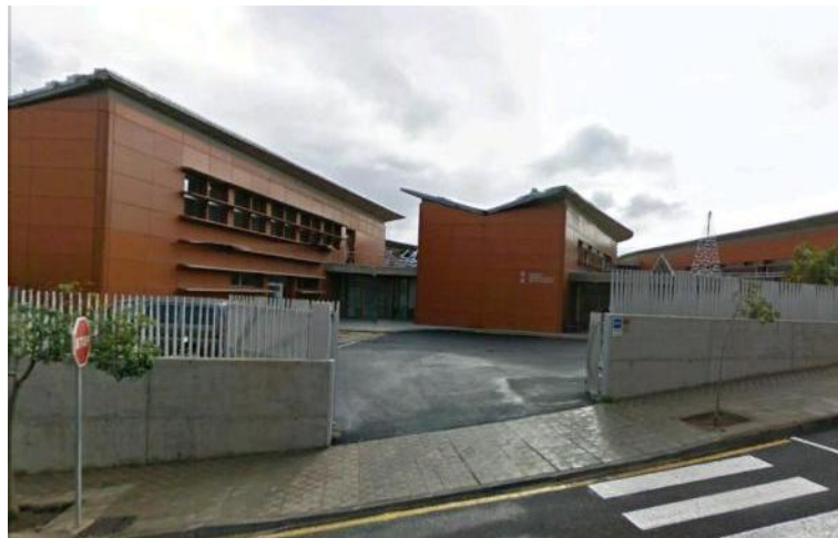
Figura 12: Hospital geriátrico de Los Dolores