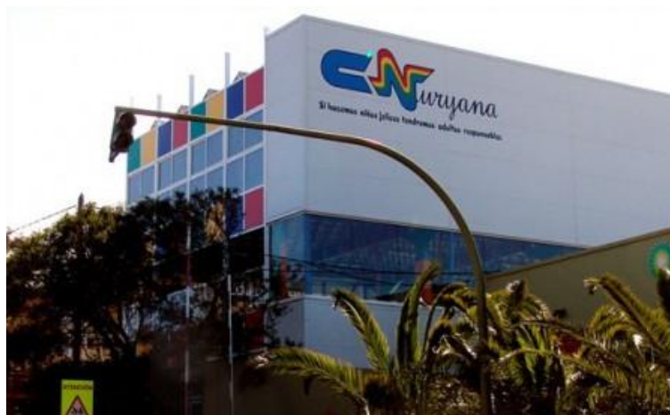
Figura 28: Colegio Nuryana