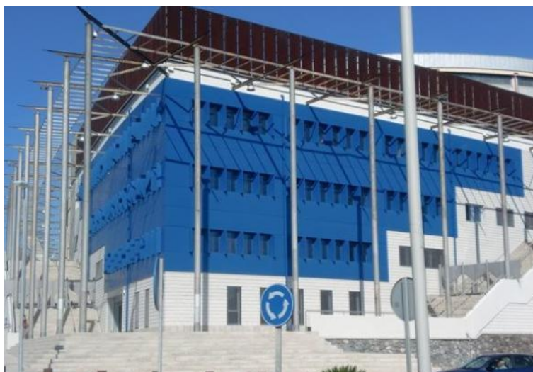
Figura 21: Pabellón Santiago Martín