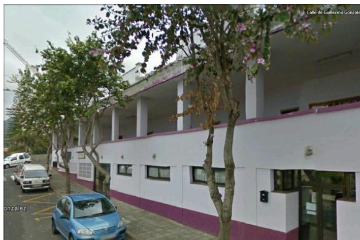
Figura 1: Tenencia de Alcaldía de Tejina