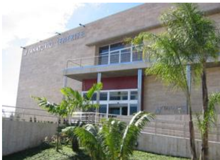
Figura 32: Tanatorio-Crematorio La Laguna