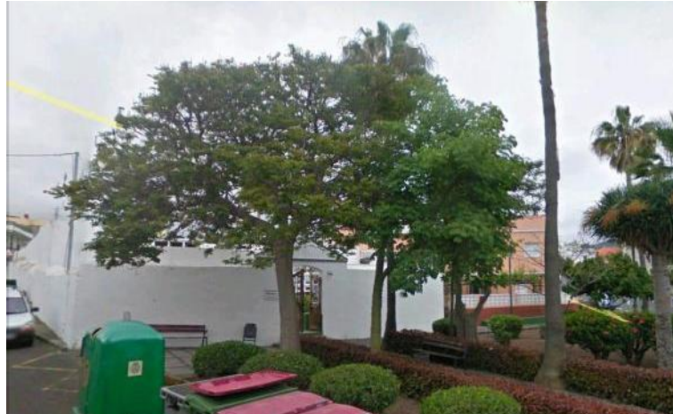
Figura 27: Cementerio de San Sebastián