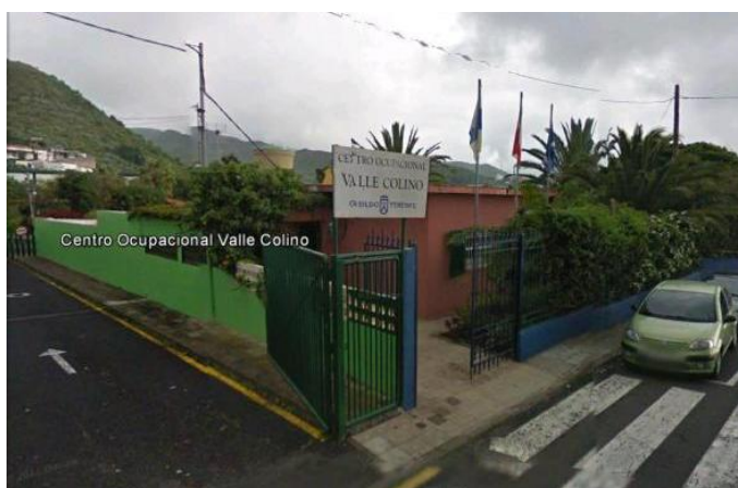
Figura 14: Centro ocupacional de Valle Colino