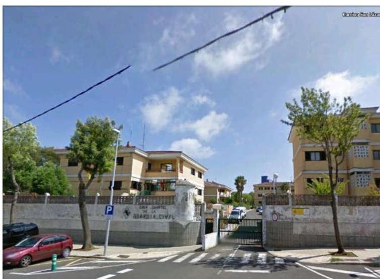
Figura 6: Cuartel de la Guardia Civil.