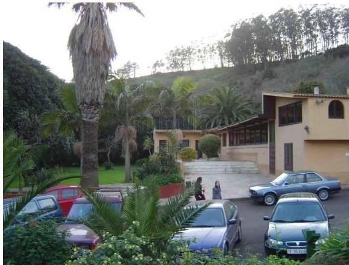
Figura 30: Club Hípico La Atalaya