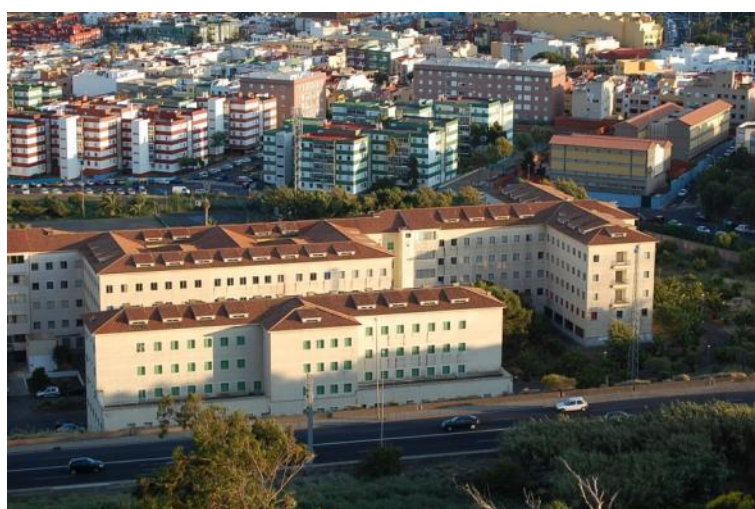
Figura 35: CPES Seminario