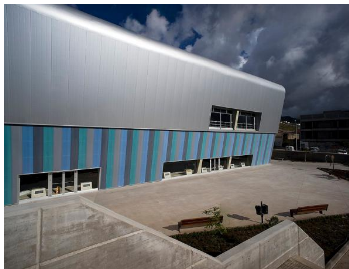
Figura 20: Complejo deportivo de piscinas de La Cuesta