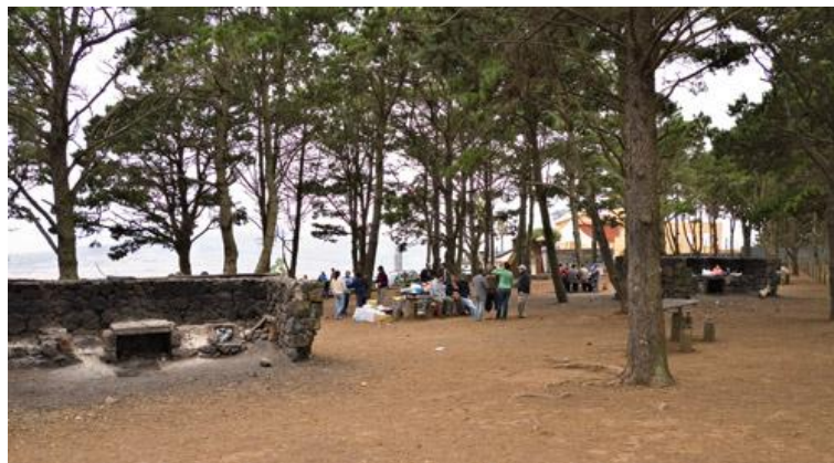
Figura 26: Parque Periurbano de la Mesa Mota