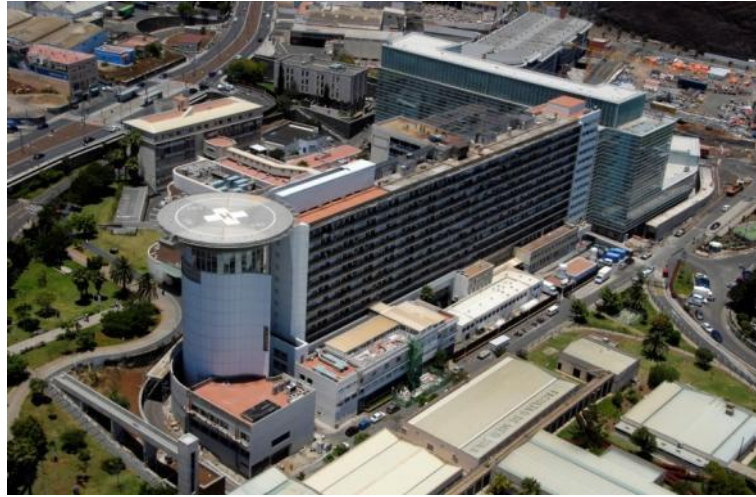
Figura 8: Hospital Universitario de Canarias