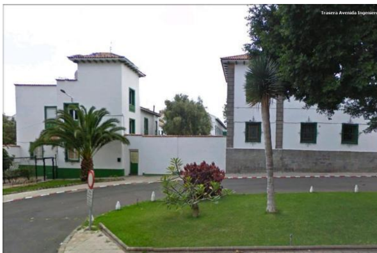
Figura 5: Cuartel de Ingenieros de La Cuesta