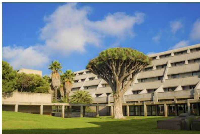
Figura 15: IES La Laboral