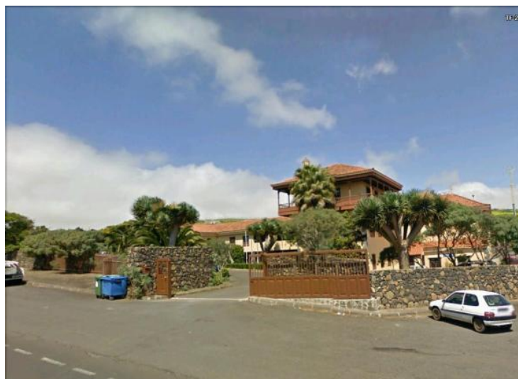
Figura 3: Instituto Canario de Calidad Agroalimentaria