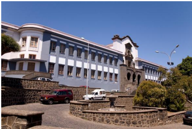
Figura 16: Universidad de La Laguna